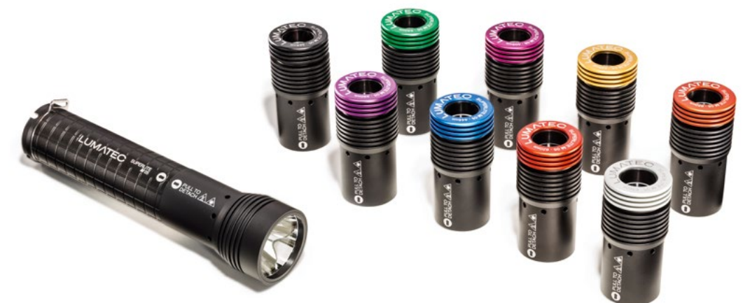
Akkupack mit Kopf und 9 Wechselköpfe

Akkulaufzeit bis zu 4h je nach Wellenlänge und Leistungsstufe